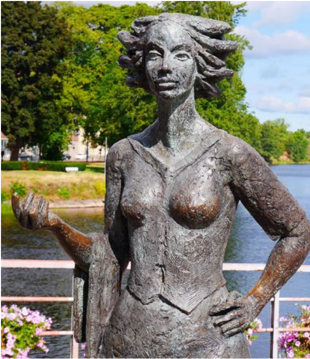
Sola i Karlstad.