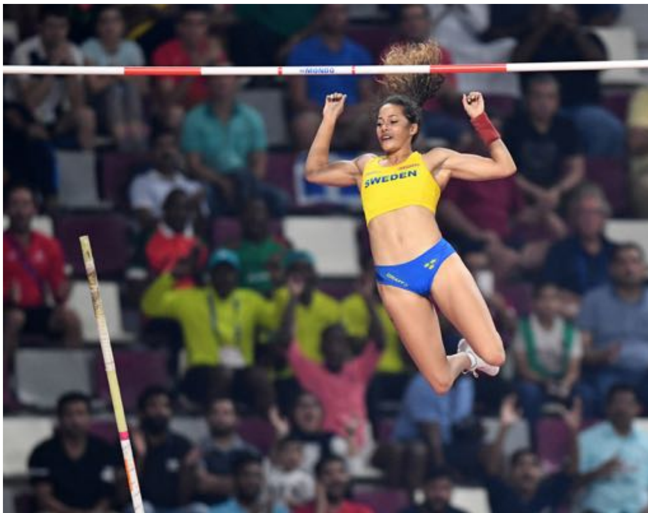
Angelica Bengtsson på VM i Doha där hon satte nytt svenskt rekord med ett bragdhopp efter att hon brutit staven. Hon belönades med Årets Prestation på Friidrottsgalan i år.