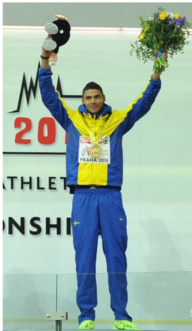
Europamästare inomhus, Prag 2015.