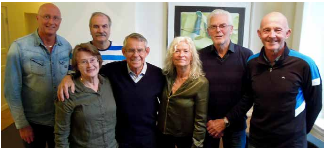
Anv utg: Rajne Söderberg, red Elisabeth Fredriksson, medarb: A-M Nenzell, T Torstensson, L Librand, Bertil Wistam.