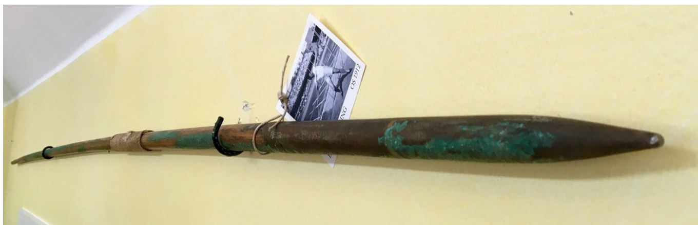
Spjut gjort av trä som Lemming tävlade med vid OS 1912.

Sitt första guld i spjutkastning vann han vid Olympiska Spelen i Aten 1906 då grenen hade premiär på OS-programmet. Funktionärerna sägs ha flytt i panik vid Lemmings första och vinnande kast när spjutet kom seglande över dem till 53,90 - nytt världsrekord. Näst bästa kast var åtta meter