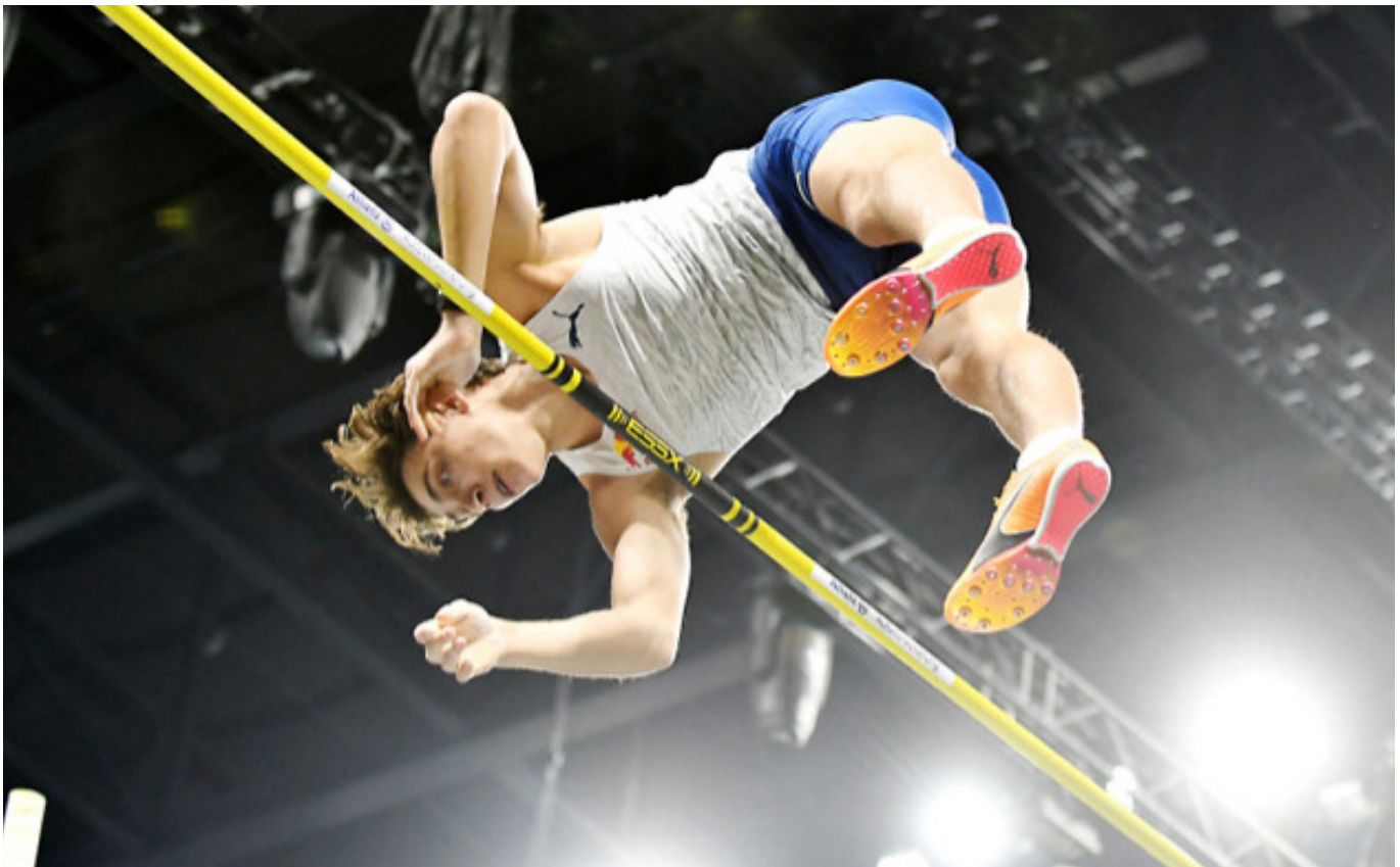
Mondo sätter världsrekord inomhus i Berlin.