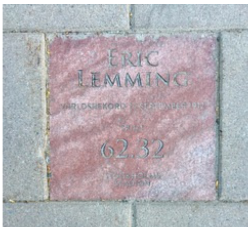
Platta till minne av världsrekordet 62.32 på Stockholms Stadion.