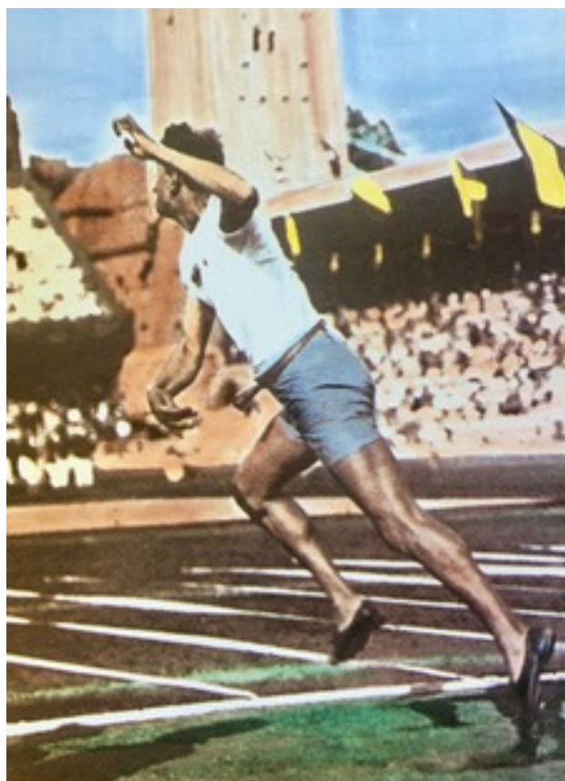
Vykort från LS 100 årsjubileum som visar Eric Lemming vid OS 1912 på Stockholms stadion