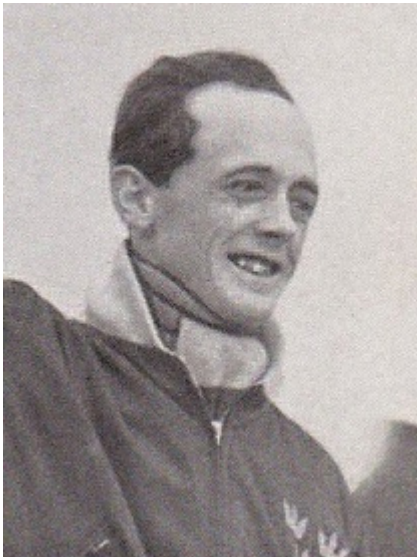
Carl-Erik representerar Sverige.