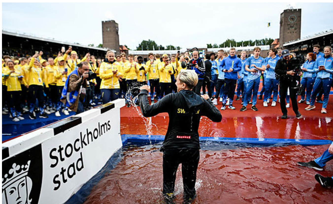
Kajsas Bergqvist får det traditionsenliga doppet i vattengraven efter segern. Det var Sveriges femte dubbelseger i rad.