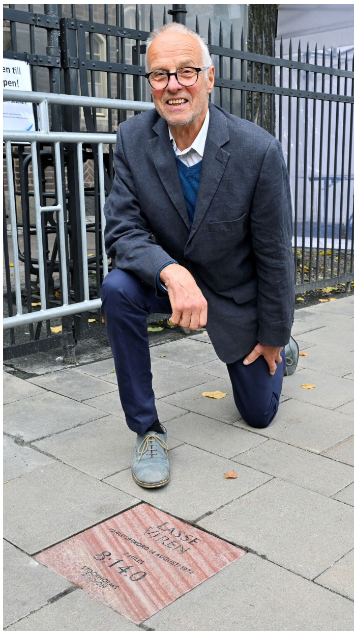
Lasse Virén vid sin sten.

SCIF - Sveriges Centralförening för Idrottens Främjande bildades 1897 och är landets första centrala idrottsorganisation och föregångare till SOK och RF. SCIF låg bakom ansökan om olympiska spelen i Stockholm 1912 samt byggandet av Stockholms Stadion och var även arrangör av spelen. Idag arbetar SCIF med att främja idrotten, bl a genom att på olika sätt redovisa idrottens historia. Föreningen utser Årets Idrottsförbund, delar ut stipendier i idrottsforskning och stödjer idrottsmuseer och sällskap.