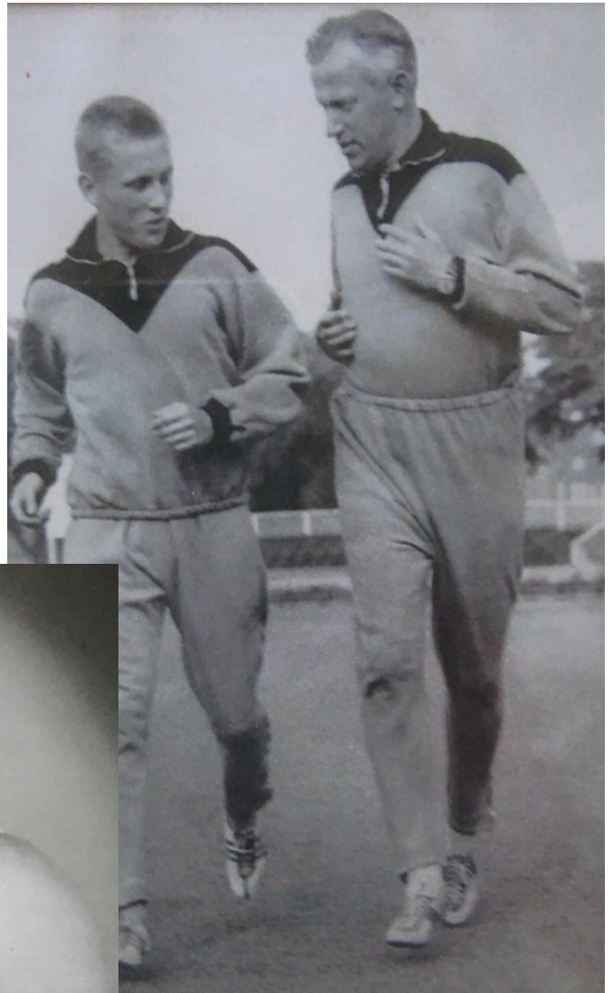
Far och son tar en joggingtur tillsammans.