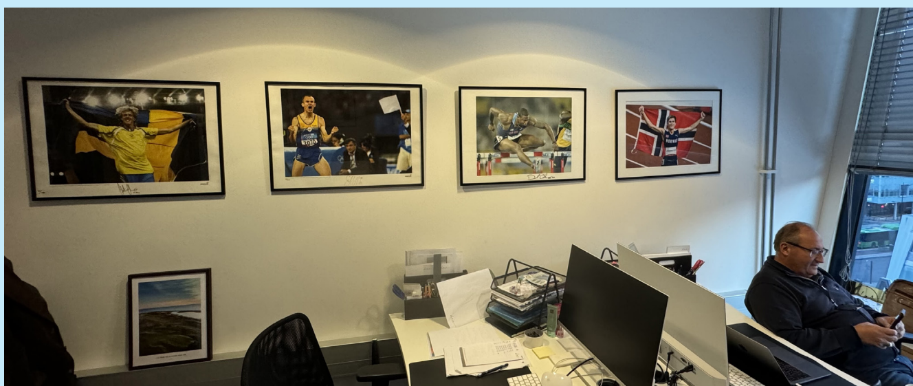
För att hamna på väggen på kontoret krävs OS- eller VM-guld.